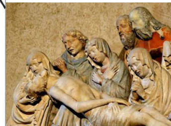
beeldengroep bewening christus, San Giusto kathedraal Trieste